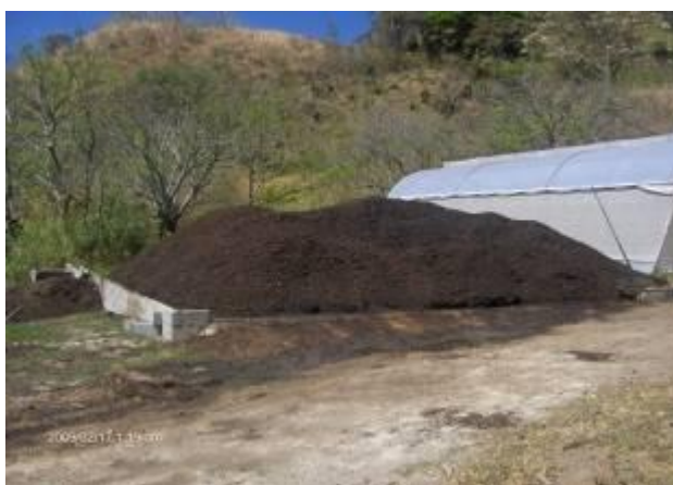
Manejo de remanentes