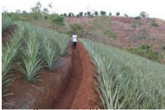
Conservación del suelo

productivas, tales como: obras físicas de conservación de suelos, siembras a contorno, manejo de sombra, poda, uso y manejo de agroquímicos, mejoramiento de pasturas, bancos de forraje, manejo de desechos sólidos y líquidos, en la fase de agroindustria se ha trabajado en buenas prácticas de manufactura (BPM) y buenas prácticas de higiene (BPH) en café.