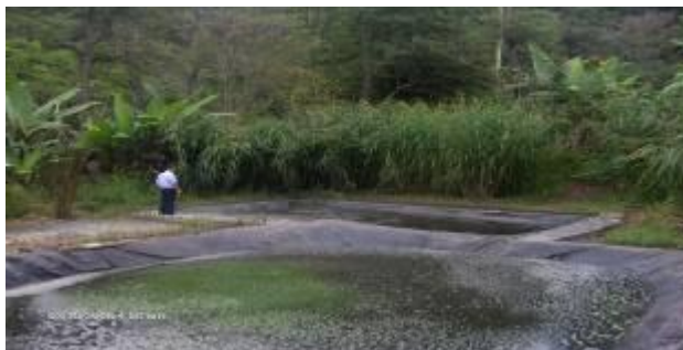
Laguna de tratamiento