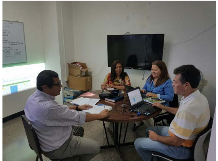
Grupo de trabajo en una sesión.

El SFE cuenta con la Unidad de Residuos de Agroquímicos, que es la responsable de definir las políticas para el control de residuos y establecer los procedimientos para su regulación. Además, existen las Unidades Regionales y las Estaciones de Control Fitosanitario que son las que ofrecen capacitación, realizan muestreos y notificaciones apoyados por el Laboratorio de Residuos que realizan los análisis de las muestras. Se remitirán vía correo electrónico al Enlace Sectorial Sepsa para que los remita al analista de Mideplan los siguientes documentos: